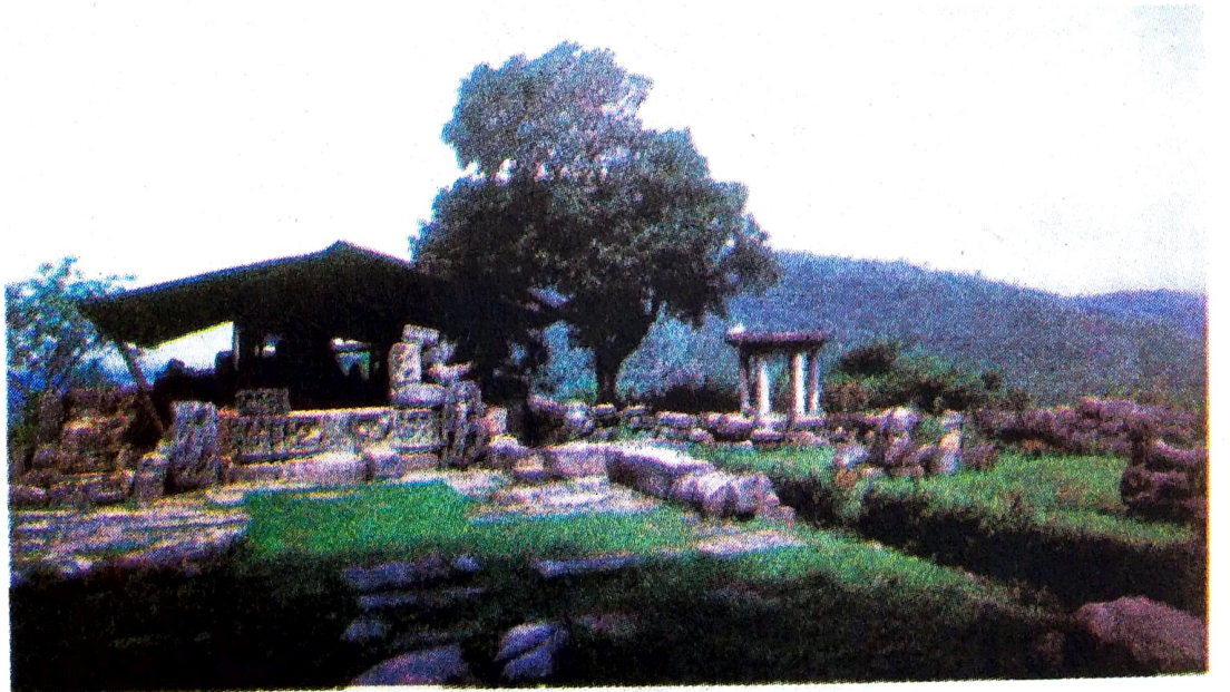
ছবি ১.৮ মদন কামদেৱ