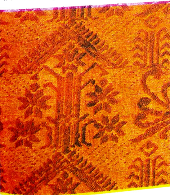
ছবি ১.৪ মুগা বস্তু

পুৰণি অসমৰ আৰ্থিক অৱস্থাৰ বিষয়ে তথ্য নিচেই কম। এই তথ্যসমূহৰ উৎস হ'ল— সাহিত্যিক বৰ্ণনা আৰু প্ৰাচীন লিপিসমূহ। কামৰূপ ৰাজ্যত শস্যৰ বিস্তৃত খেতি হৈছিল। ভাস্কৰ বৰ্মাৰ শাসন কালত অহা চীনা পৰিব্ৰাজক হিউৱেনচাঙে কামৰূপত জলসিঞ্চন প্ৰণালী থকা বুলি উল্লেখ কৰি গৈছে। পাহাৰীয়া মানুহে জুম পদ্ধতিৰে খেতি কৰিছিল। সমতলভূমিত খেতি যথেষ্ট ভাল হৈছিল। ধান মৰাপাট, কঁঠাল, আমলখি, ৰুদ্ৰাক্ষ আৰু কুঁহিয়াৰৰ বাহিৰে বিভিন্ন জাতৰ ফল-মূল আৰু শাক-পাচলি প্ৰচুৰ পৰিমাণে পোৱা গৈছিল।