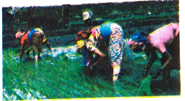
ছবি ১.৩ বোকা

আংগামী নগাসকলে পোন প্ৰথমে উত্তৰ-পূব অঞ্চলত জলসিঞ্চন পদ্ধতিৰে খেতি কৰিছিল।