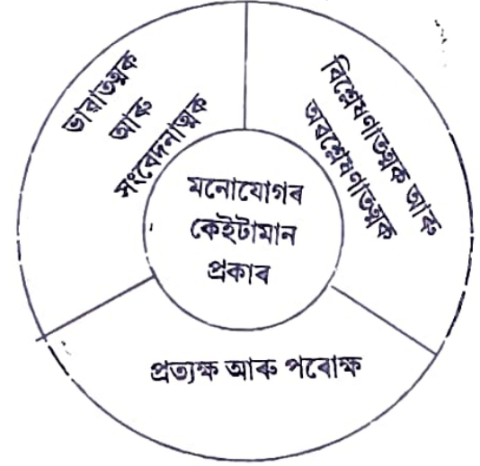
মনোযোগৰ কেইটামান প্ৰকাৰ

কৰি এক গোট হিচাপে মনোযোগ ন্যস্ত কৰা হয়। উদাহৰণস্বৰূপে এখন ছবি নিৰীক্ষণ কৰোতে বিভিন্ন দিশ পৃথক পৃথক হিচাপে পৰ্যবেক্ষণ নকৰি যেতিয়া একক হিচাপে ছবিখনৰ প্ৰতি মনোযোগ দিয়া হয়, সেয়ে সংশ্লেষণাত্মক মনোযোগ।