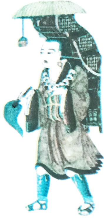
চীনা বৌদ্ধ ভিক্ষু হিউয়েনচাং

তুলিছিল। মন্দিৰৰ নৰ্তকীসকলে নৈৰ পাৰত বাস কৰিছিল। তেজপুৰ নগৰৰ পূব সীমাত বামুণীপাহাৰ নামে পাহাৰৰ টিলাত সিঁচৰতি হৈ থকা প্ৰাচীন মন্দিৰৰ ধ্বংসাৱশেষে শালস্তম্ভ বংশীয় ৰজাসকলে নিৰ্মাণ কৰা সেই হিমালয় সদৃশ উচ্চতাৰ মন্দিৰলৈ ইঙ্গিত দিয়া যেন লাগে। পণ্ডিতসকলে এই হাৰুপেশ্বৰ বা হটপেশ্বৰ নগৰক আধুনিক তেজপুৰ নগৰৰে একে আছিল বুলি ক'ব বিচাৰে।