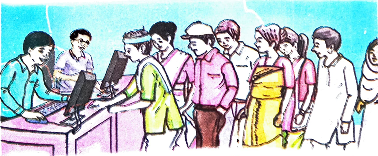
বেংকত গ্ৰাহকৰ শাৰী