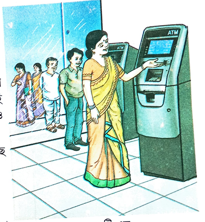
এ টি এম