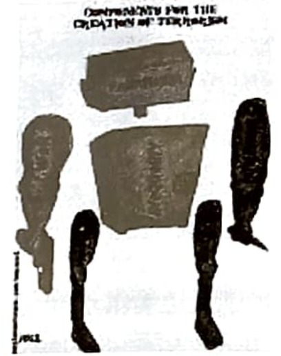
সন্ন্যাসবাদ সৃষ্টিৰ উপাদানসমূহ

সুপ্ত হৈ থকা ক্ষোভ আৰু সংঘাতৰ কাৰণসমূহ আলোচনা